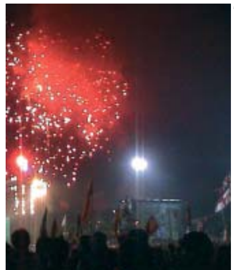
Abschlussfeuerwerk am Jamboree in Thailand

Zum 20. Jamboree trafen sich unter dem Motto „Share our World, share our culture“ über 30.000 Pfadfinder und Pfadfinderinnen aus über 150 Nationen in Thailand. In Sattahip (Chonburi Provinz), direkt an der Küste gelegen, 150 km südlich von Bangkok waren auch gut 100 PfadfinderInnen aus Österreich mit von der Partie.